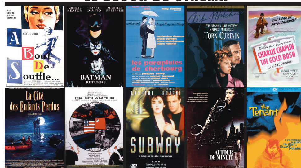
EXTRAITS ET FILMS PROJETÉS

EXECUTIVE PRODUCTION SOFILM PATRICK SANDRIN